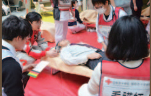
3月5日(土) 院内災害訓練を実施し、災害拠点病院としての行動を確認しました。