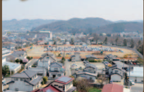
1月12日(火) 新病院建設に係る造成工事・道路拡幅工事が始まりました。(現病院屋上より撮影)