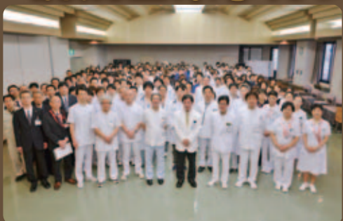
1月4日(月) 院長年頭挨拶。気持ちを新たに、職員一丸となって進んでまいります。