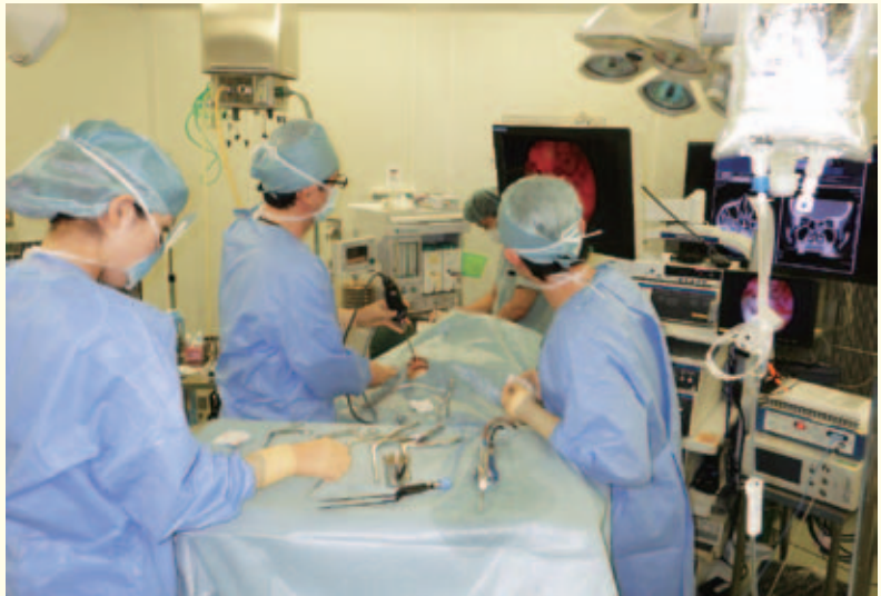
写真2 鼻副鼻腔内視鏡手術

近代化が進んでいる現在でも慢性副鼻腔炎（蓄膿症）は依然として多く存在し、現代病と称されるアレルギー性鼻炎も増加傾向にあります。近年、副鼻腔の手術は内視鏡手術に移行しており、歯齦部を切開する方法はほとんど行われません（写真2）。アレルギー性鼻炎で、内服薬でなかなか症状が抑えられない場合は、手術によって症状の劇的軽減が期待できる場合もあります。より快適な日常生活を送っていただくためにどのような治療が最適なのかを分かりやすく説明し、薬物療法や手術療法、免疫療法など、患者様一人一人に対してオーダーメイドな治療を提供させていただきます。