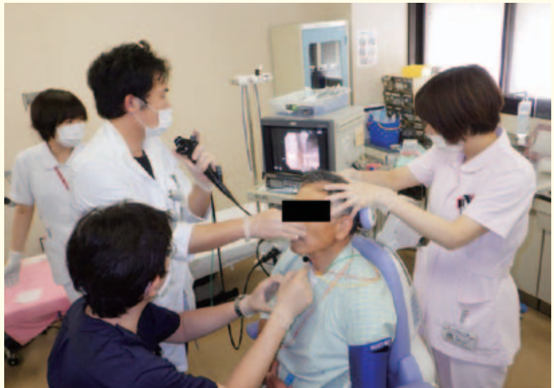
写真1 局所麻酔下の喉頭手術

嚥下障害は、脳梗塞後や神経疾患に続発して起きることが多いですが、単なる加齢による変化としても起きることがあります。なんとなく飲み込むときに引っかかる、水を飲んだときにムセやすくなるなどで始まり、気管内に唾液や食物が流入する誤嚥状態となると誤嚥性肺炎を来すようになります。口腔ケアやりハ