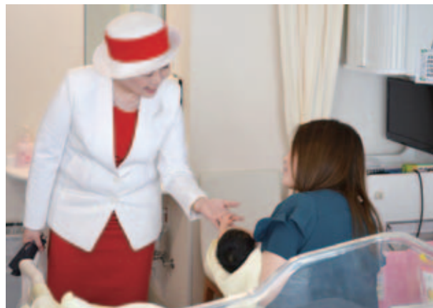
病棟（レディースフロア）を御視察される妃殿下