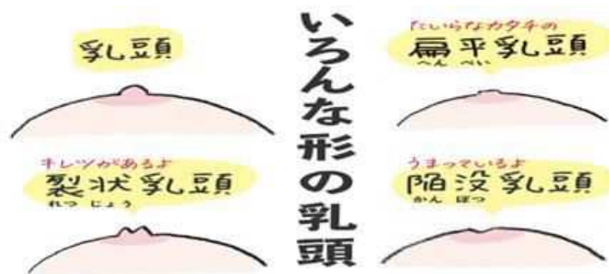
【出典】withセシル. 【挿絵画像】いろいろな形の乳頭. https://with.seicil.com/products/sg-nyuto (最終アクセス 2024年 9月26日) ※画像の無断転載禁止

ご自身の乳房タイプ、乳頭タイプ、乳・乳輪の首の硬さ、伸びはどうでしょうか？ 扁平乳頭や裂状乳頭、陥没乳頭の方は妊娠中からの お手入れが特に大切になります。