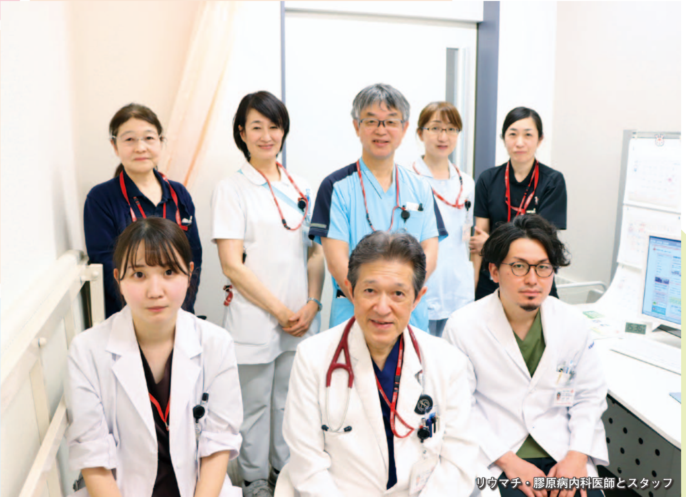
リウマチ・膠原病内科医師とスタッフ

基本理念 「わたしたちは、 いのちと健康、尊厳を守るため、 より良い医療を目指します」